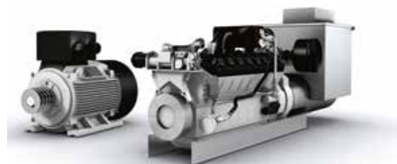
Verschraubung von Anbauteilen an Motorblöcke aus Stahlguss mit der duoHARDtip® Schraube