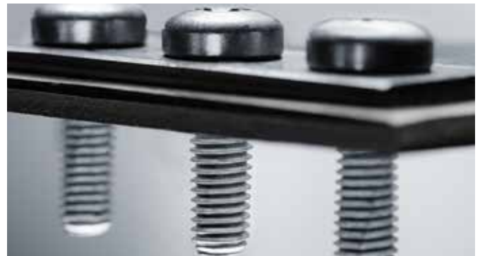
duoHARDtip Spiralform® M5x16 nach der Direktverschraubung in 1,6 mm MSW 1200