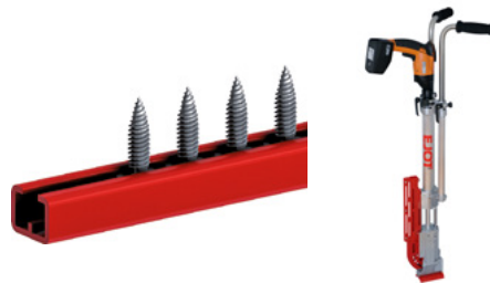
EJOFAST® JF-Schrauber als Leihgerät erhältlich.