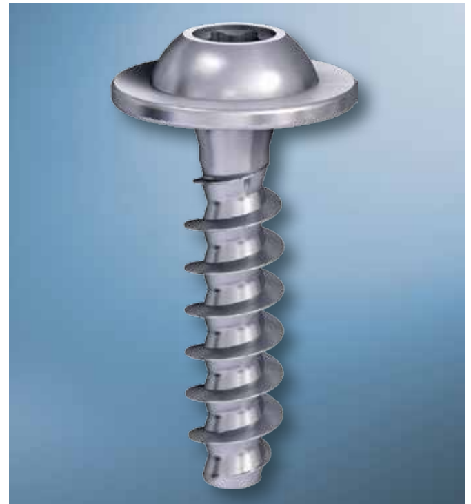
Die EJOT PT® Schraube mit 30° Flankenwinkel und Kernausschneidung

Bei Materialien mit hohem Füllstoffanteil oder hoher Eigenfestigkeit bietet sich die Verwendung der EJOT DELTA PT® an.